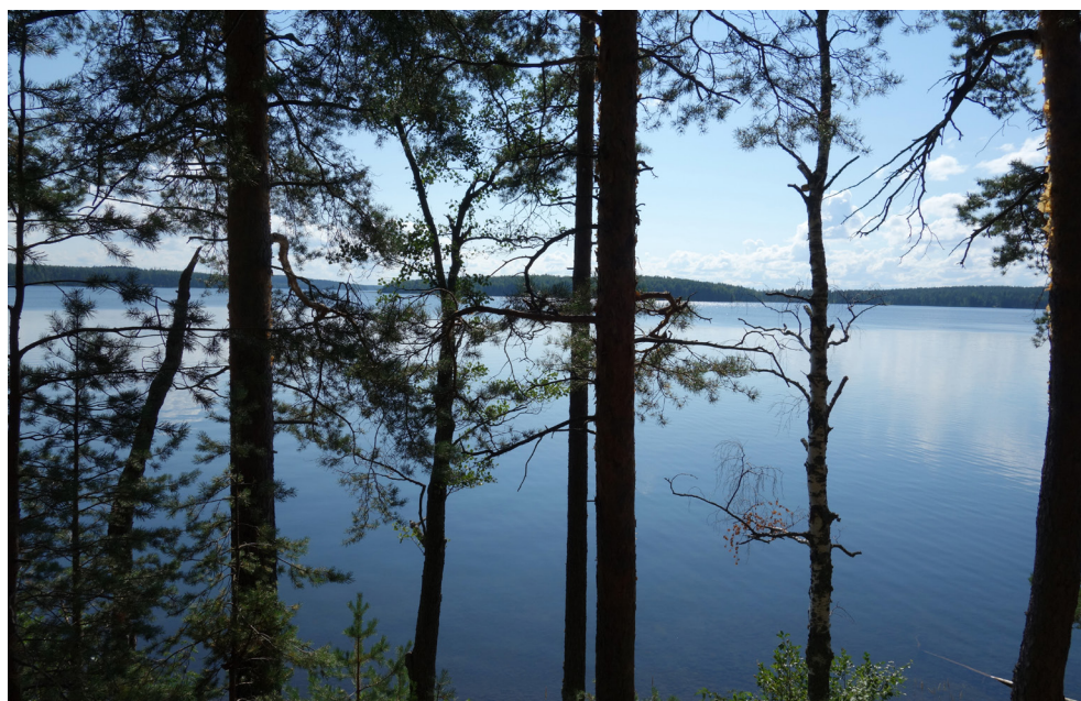
Punkaharjuåsen är en av Finlands i särklass skönaste naturupplevelser.

Endast 20 minuter från Nyslott finns världens största träkyrka på orten Kerimäki, färdigställd 1847.