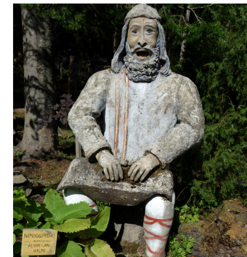
Till Parikkala kommer besökare även från utlandet för att se den unika statyparken.