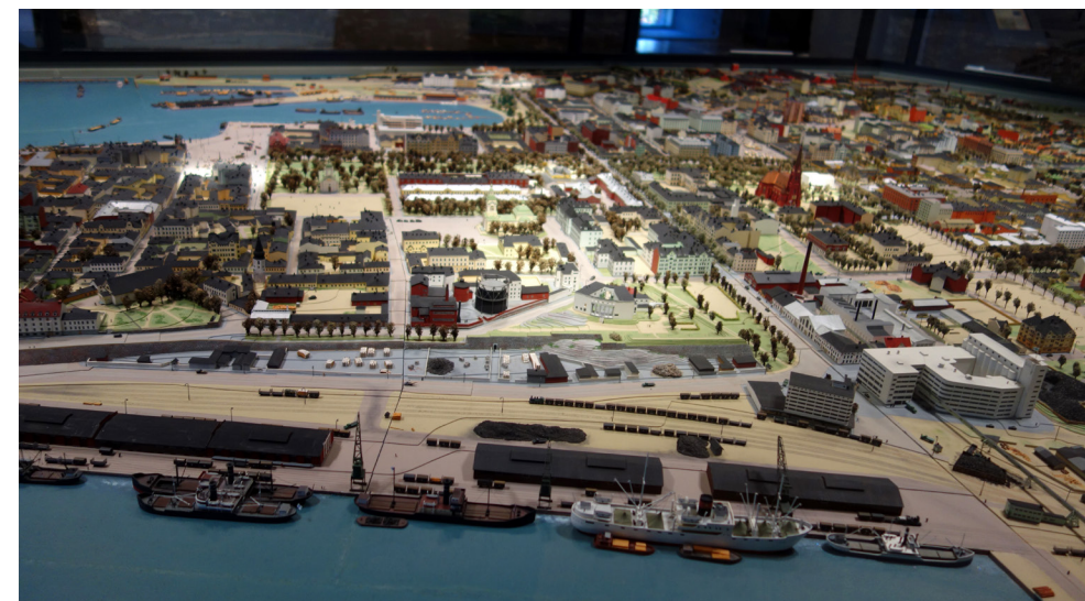
Till Villmanstrands absoluta sevärdheter hör Södra Karelen museum och dess miniatyrmodell av det gamla Viborg.

– Jag förstår att det måste vara ett avbräck inte minst för de östra delarna av Finland. Här pågick väl en hel del gräns-