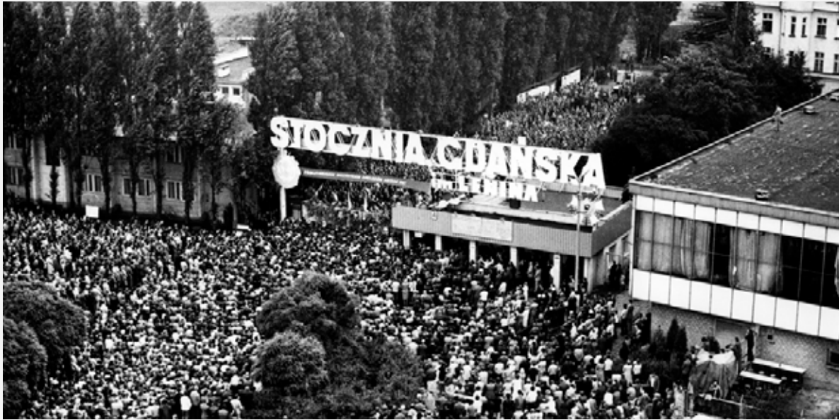
Storstrejken vid varvet i Gdansk år 1980. Arbetarna läste in sig på varvet och krävde att få förhandla direkt med regeringen inför direktsänd television för att minska regimens möjligheter att manipulera deras krav.