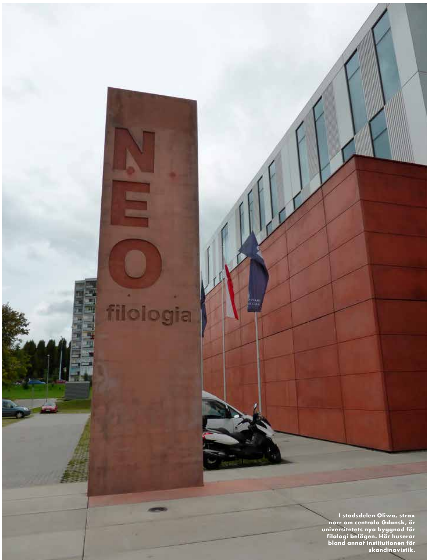
I stadsdelen Oliwa, strax norr om centrala Gdansk, är universitetets nya byggnad för filologi belägen. Här huserar bland annat institutionen för skandinavistik.