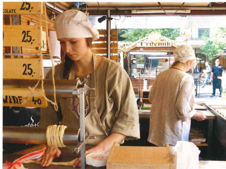
Vid en mängd stånd i centrala staden kan man handla olika godsaker.

Den genomsnittlige tjecken betalar så kallad platt skatt om 15 procent på sin lön. Däremot beskattas inte pensioner.