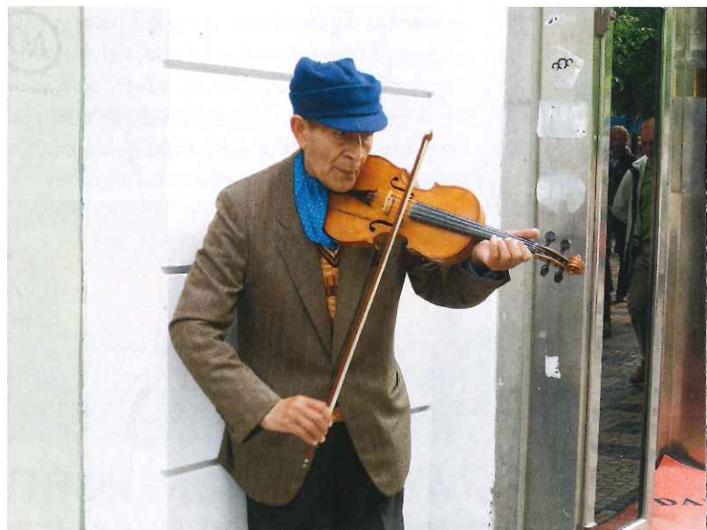
En äldre herre drygar ut sin pension genom att spela fiol för förbipasserande.