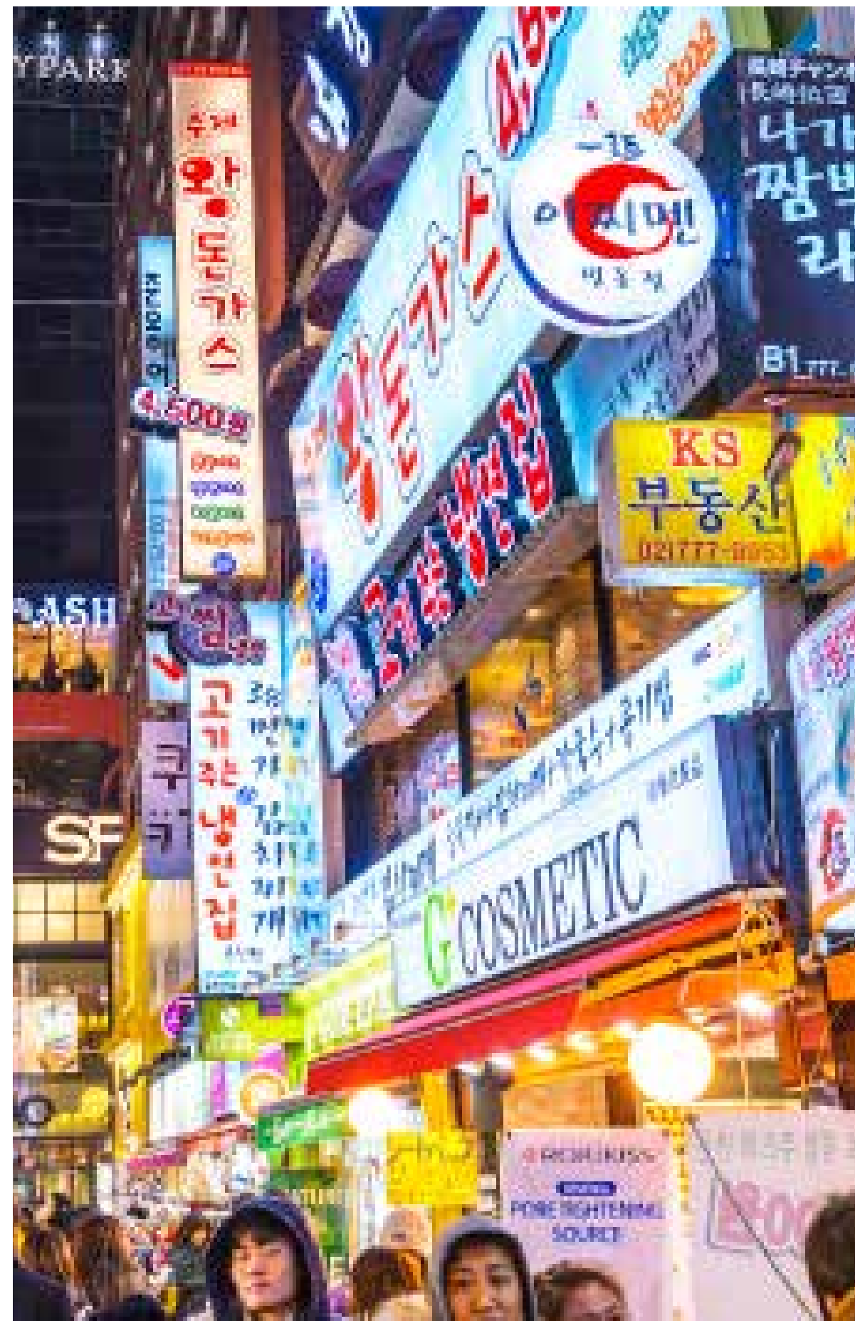
Syd Koreas huvudstad rymmer över tio miljoner invånare. Internationella företag, som LG, Samsung och Hyundai, har sina säten här.

Syd Korea är i dag världens trettonde största ekonomi och man ligger mycket långt framme inom exempelvis varvsindustri , biltillverkning samt olika former av högteknologi. Som kuriosum kan nämnas att populärmusik på senare år blivit en exportprodukt. Sångare och musiker inom det som kallas K-pop har slagit igenom långt utanför landets gränser.