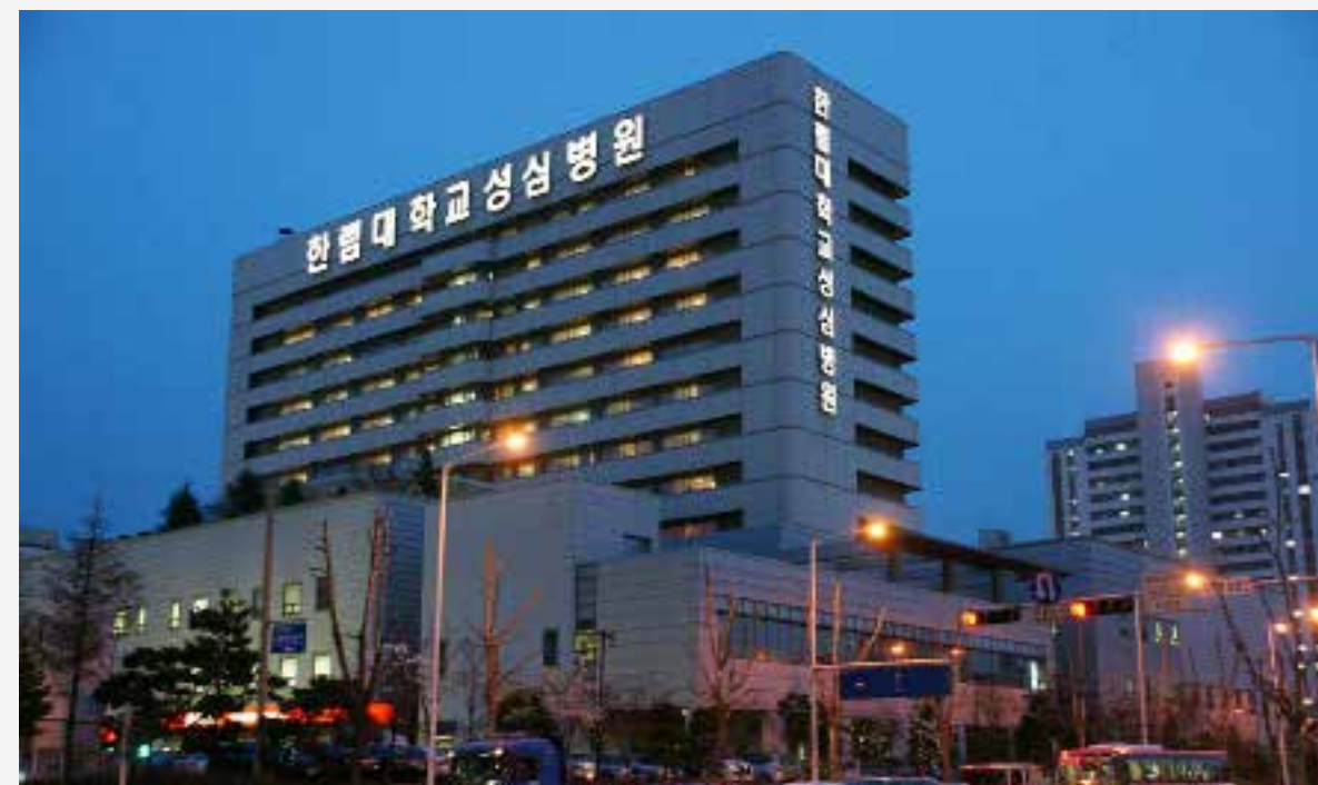
Väst möter öst. Uppsala universitet samarbetar med detta universitet, Hallym University, i Sydkorea.