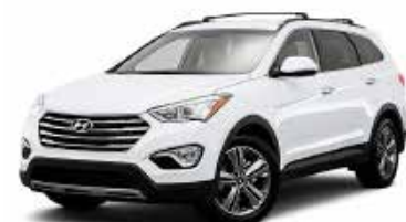
Hyunda grundades 1967 i Syd Korea.