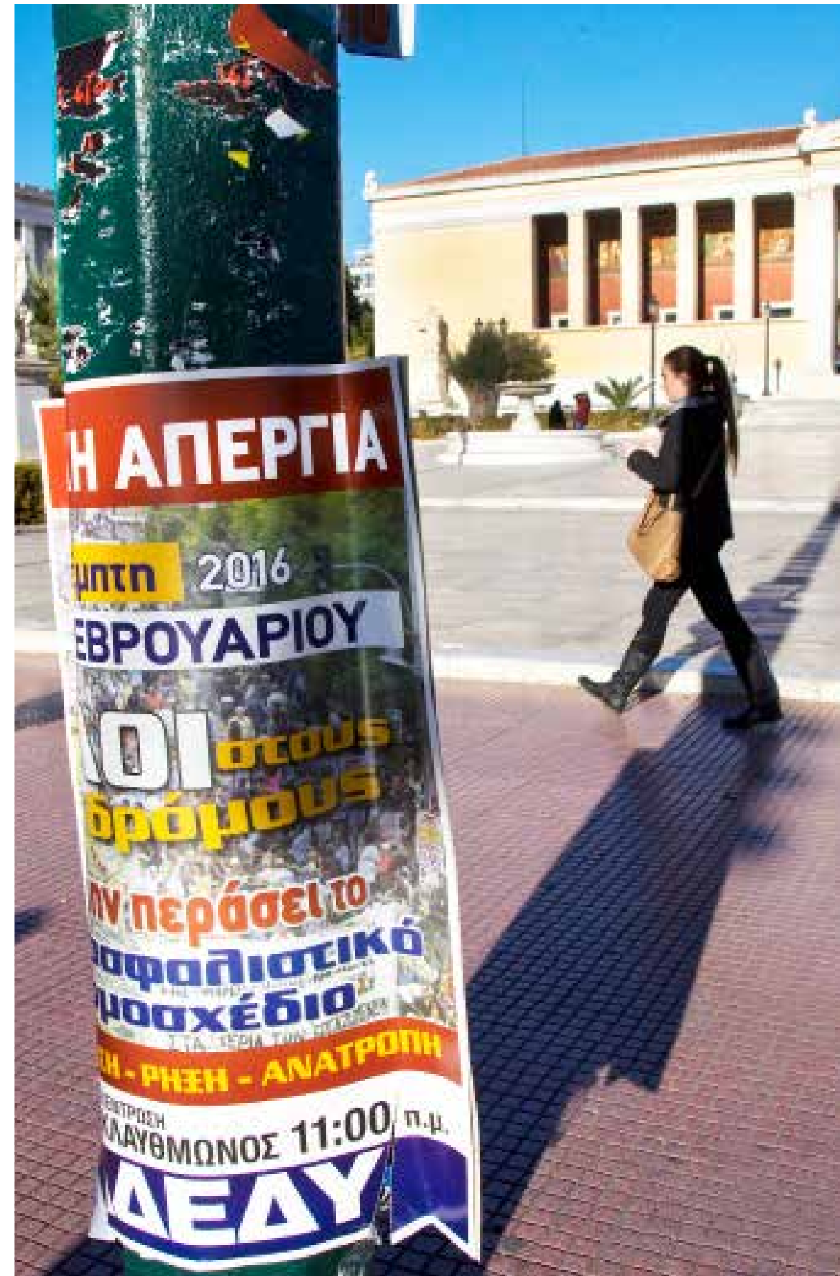
→ Ett plakat utanför Athens universitetsbyggnad uppmanar till strejk.

Den grekiska ekonomiska krisen kan till stora delar dateras till sommaren 2010. Från då och till dags dato har reallöner i landet sjunkit med omkring 30 procent. Läget blev akut sommaren 2015, då Grekland inte förmådde återbetala lån på runt 1,6 miljarder euro till den internationella valutafonden, IMF. Greklands statsskuld ligger en bra bit över 300 miljarder euro, det vill säga motsvarande mer än 3 000 miljarder kronor. De extremt tuffa besparingsåtgärderna gör att få bedömare tror på en vändning uppåt de närmsta åren, även om turistnäringen delvis återhämtat sig.