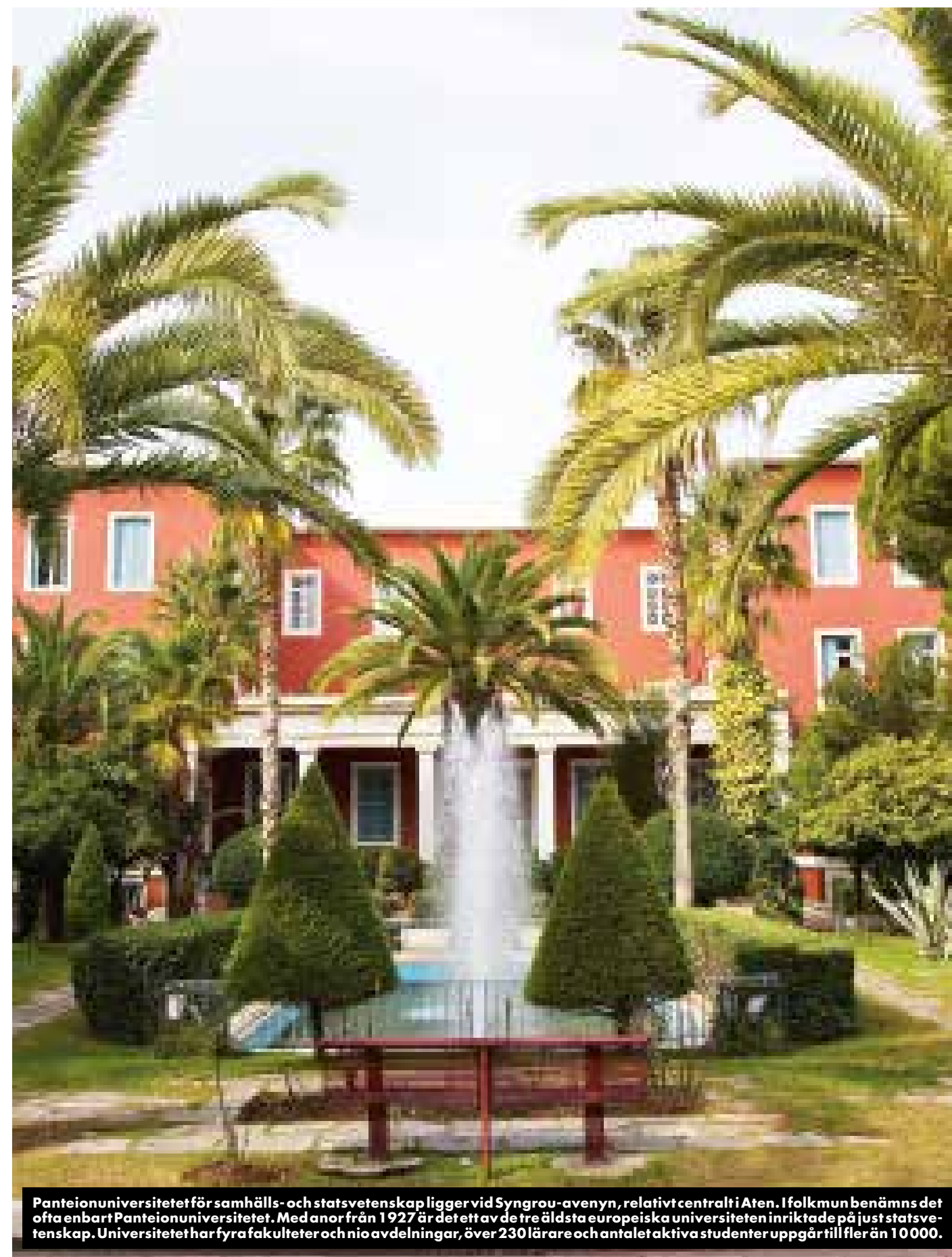
Panteionuniversitetet för samhälls- och statsvetenskap ligger vid Syngrou-avenyn, relativt centralt i Aten. I folkmun benämns det ofta enbart Panteionuniversitetet. Med anor från 1927 är det ett av de tre äldsta europeiska universiteten inriktade på just statsvetenskap. Universitetet har fyra fakulteter och nio avdelningar, över 230 lärare och antalet aktiva studenter uppgår till fler än 10 000.