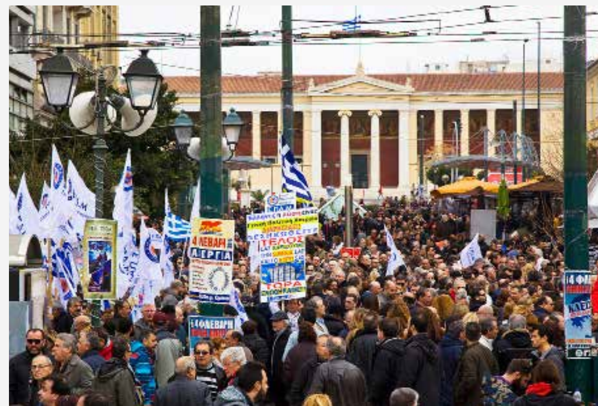
Mer än 40 000 människor deltog i protester mot regeringen den 4 februari. Demonstrationståget utgick från Athens universitetsbyggnad.

– Jag hade fantastiska studenter vid universitetet och älskar lärarjobbet, därför hoppas jag att en dag kunna återvända till akademien. ○