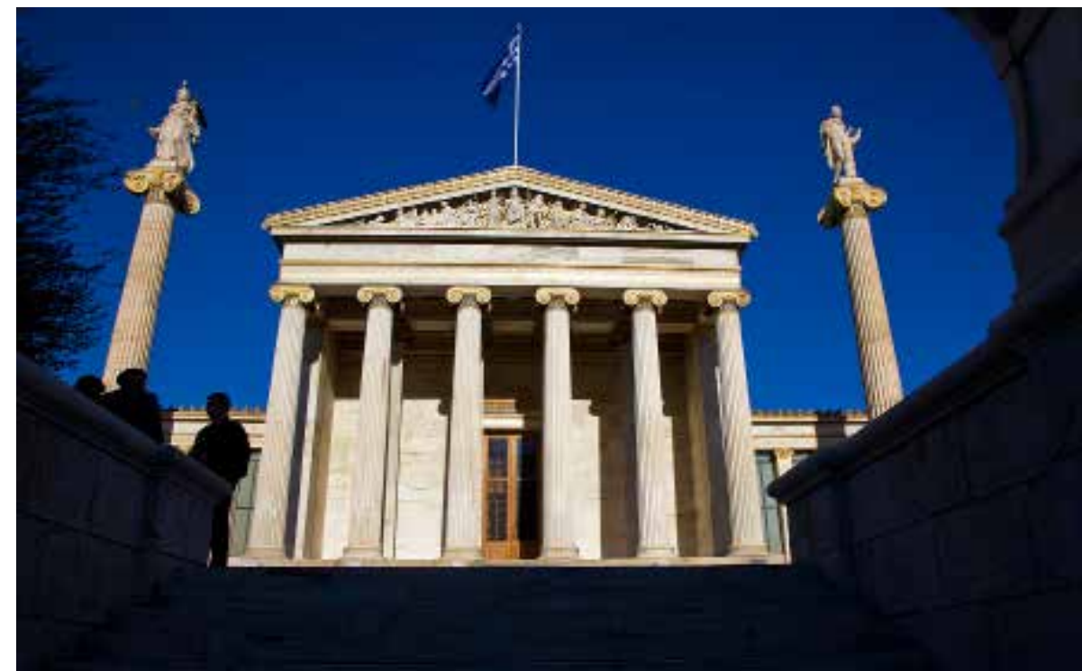
Den grekiska akademikan inte längre leva på sitt historiska arv. I dag kämpar lärarna med extrema nedskärningar. På bildens synhuvudbyggnaden för Athens akademi.

Vi ska snart höra en facklig röst från Panteion-