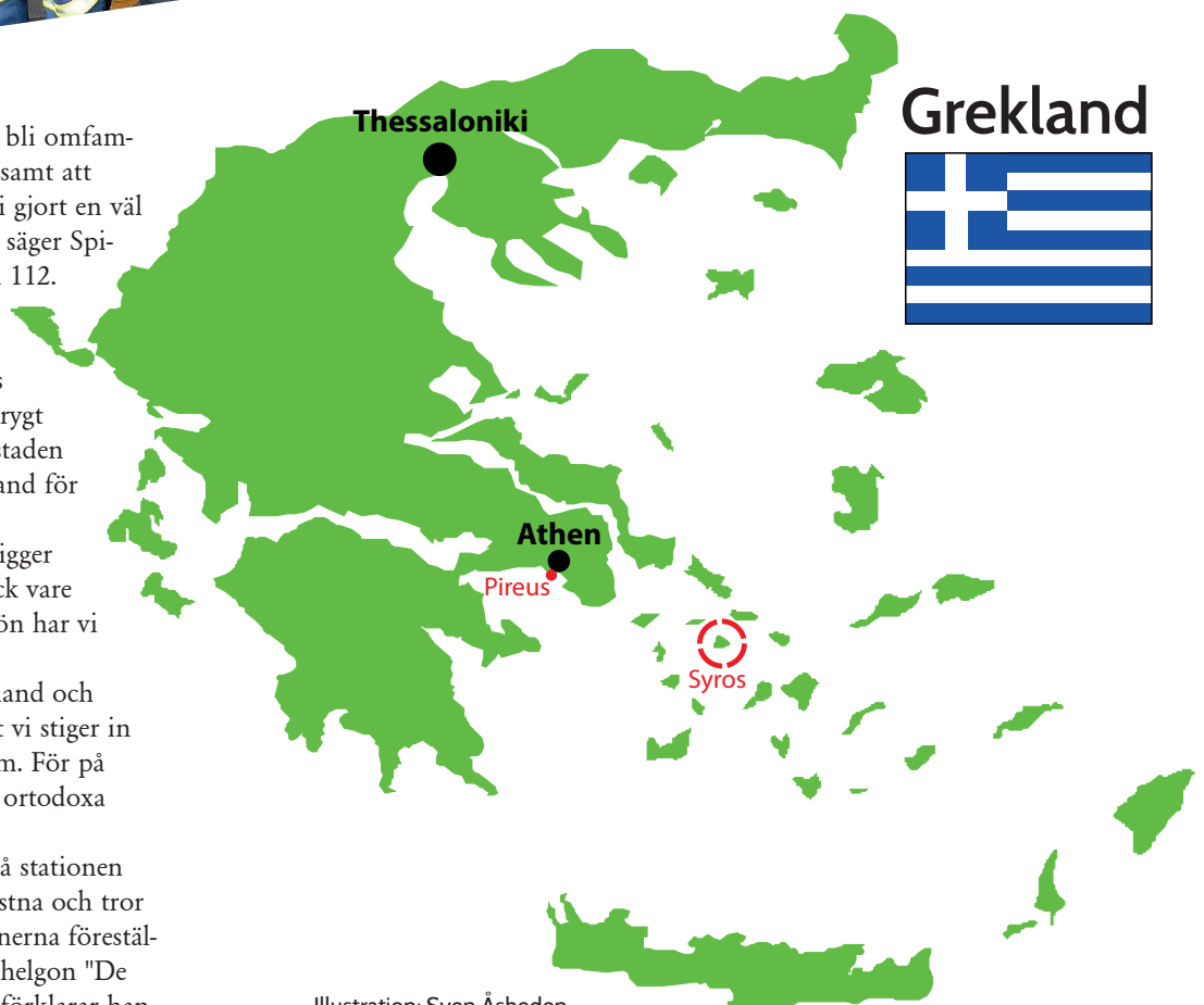
Illustration: Sven Åsheden

- Vi har de här bilderna på stationen därför att vi är ortodoxa kristna och tror att de hjälper oss. En av ikonerna föreställer brandkårens egna skyddshelgon "De tre ynglingarna i kaminen", förklarar han